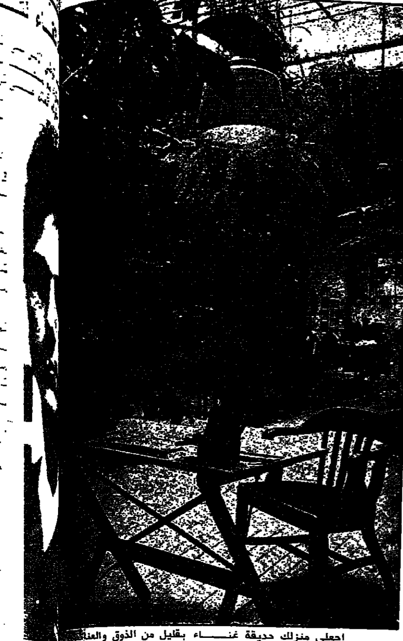
اجعتي منرك حديقة غشاء بقليل من الذوق والعلم